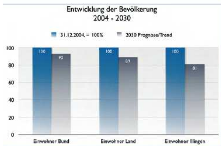
Abb. 1.1, Rückgang der Bevölkerungszahlen in Bund, Land und Gemeinde Illingen - Prognose bis 2030

Das Schaubild zeigt, dass sowohl im Bund als auch im Land die Bevölkerungszahlen rückläufig sind. Illingen selbst weist darüber hinaus gegenüber dem Bundes- und Landestrend einen noch signifikanteren Rückentwicklungstrend in den Bevölkerungszahlen aus. Diese Entwicklung lässt sich nicht umkehren, lediglich vielleicht etwas abschwächen durch erhöhte Zuwanderungszahlen oder Steigerung der Geburtenzahlen.